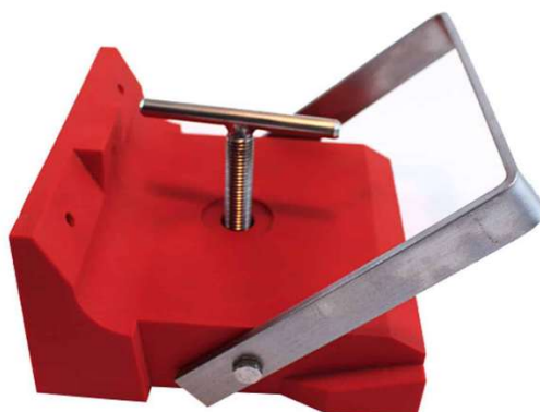
Figure 1 : Vue 3D